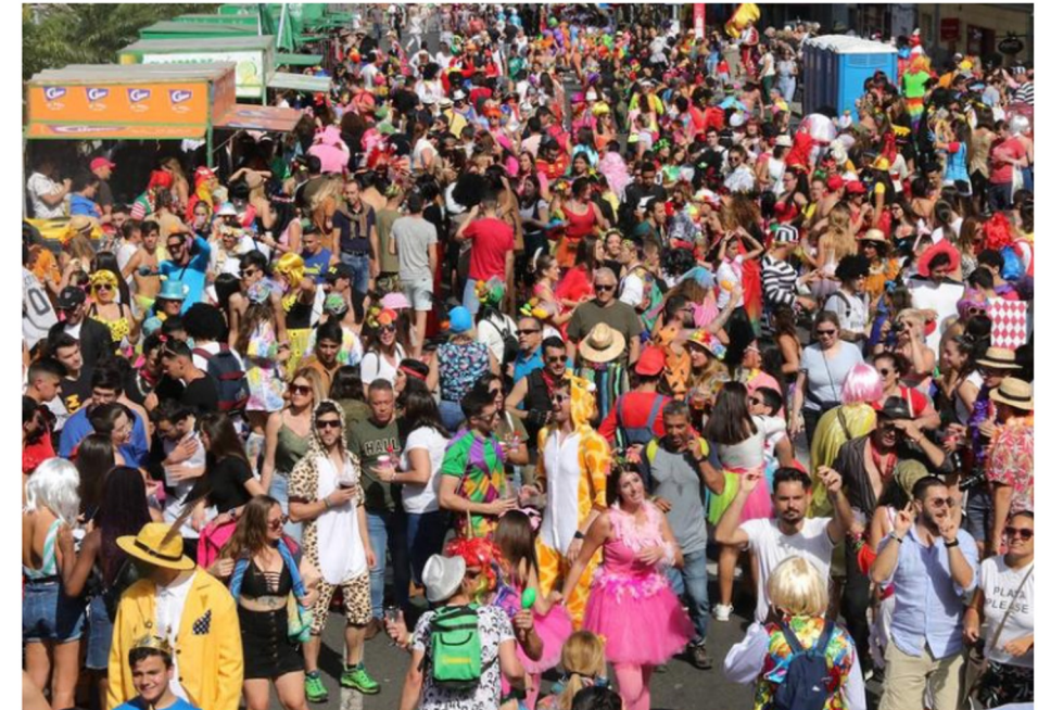
Celebración del carnaval de día de Vegueta en 2019. C7

El TSJC concluye que no se puede vulnerar derechos fundamentales de los residentes año tras año